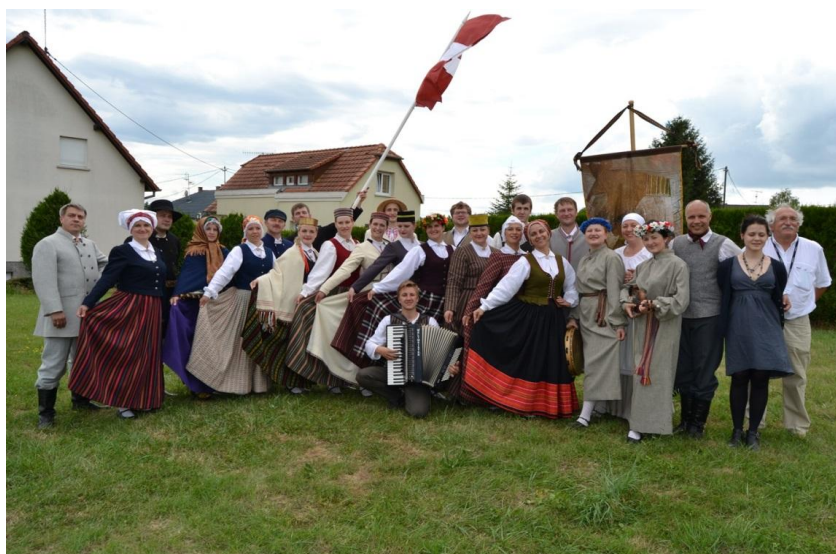
3.attēls - deju kolektīva „Piebaldzēni” viesošanās Berštetē

Dejotājus uzņēma franču ģimenēs; tas mūsu pašdarbniekiem ļāva tuvāk iepazīt Francijas kultūru un ikdienu. Vizīte tika plaši atspoguļota Elzasas reģionālajā presē. Festivālā piedalījās arī dalībnieki no Francijas, Bolīvijas un Dominikas Republikas.