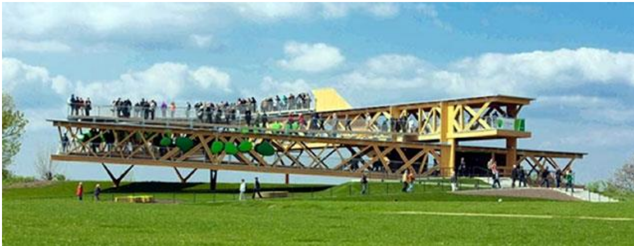
Skatu laukums nesen izveidotajā cietokšņa parkā. Tas ir veidots no vietējos mežos iegūtiem kokmateriāliem. Mežniecības, zemkopības, pārtikas un vides ministrijas projekts, Reinzeme – Pfalca.